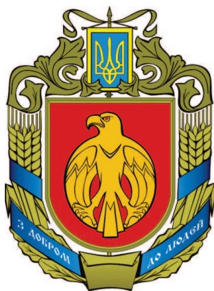
Герб Кіровоградської області