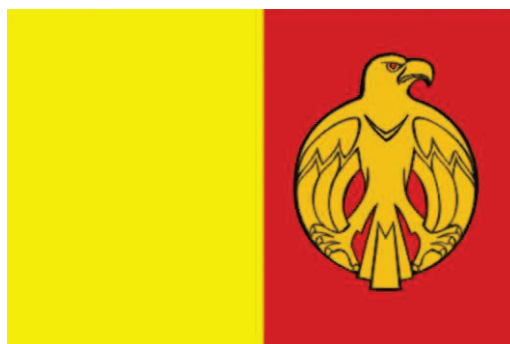
Прапор Кіровоградської області